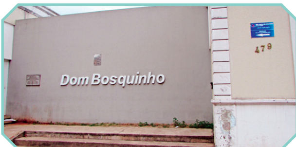
Situado na Região Leste, porém atende todas as Regiões de Campinas