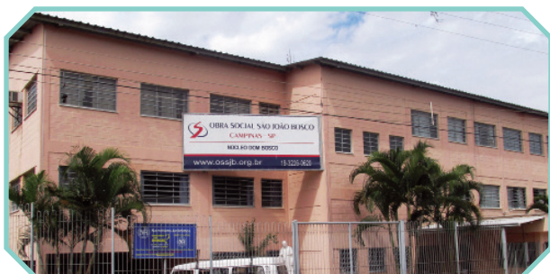
Situado na Região Sudoeste, atende aos moradores deste território

Rua Daniel de Godói Pereira, 42 – Vida Nova II Campinas/SP – CEP: 13057-541 Fone: (19) 3226.0620 / (19) 99645-2727 E-mail: nucleovn@ossjb.org.br