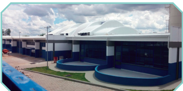
Situado na Região Sul, atende aos moradores deste território

Rua João Canaes S/Nº – Vila Taubaté ( Gleba B) Campinas/SP – CEP: 13049-040 / 13051-042 Telefone: (19) 4141-1066 E-mail: cei.franciscoamaral@ossjb.org.br