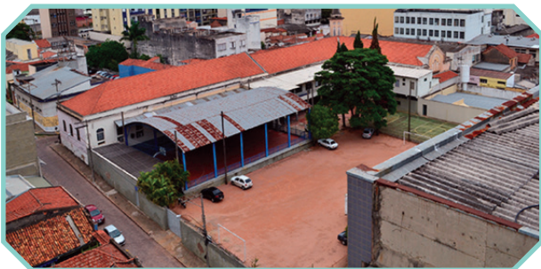
Situado na Região Leste, porém atende todas as Regiões de Campinas