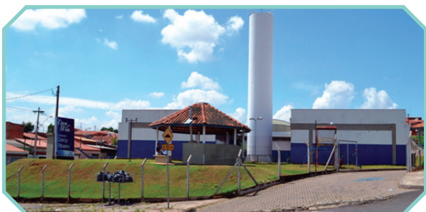
Situado na Região Sudoeste, atende aos moradores deste território

Rua Cezário José Gebara S/N - Vida Nova II Campinas/SP – CEP: 13057-545 Telefone: (19) 3266-7798 E-mail: cei.darcyribeiro@ossjb.org.br