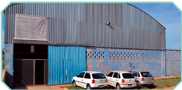
Situado na Região Sul, atende aos moradores deste território

Rua Mauro Fialho Garcia, 75 – Vila Taubaté (Gleba B) Campinas/SP – CEP: 13051-000 Fone: (19) 3229-6574 / (19) 99653-3095 E-mail: nucleooziel@ossjb.org.br