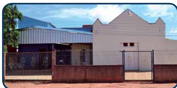
Situado na Região Sul, atende aos moradores deste território