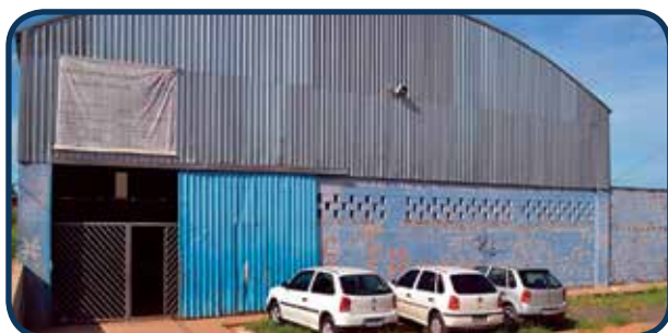
Situado na Região Sul, atende aos moradores deste território