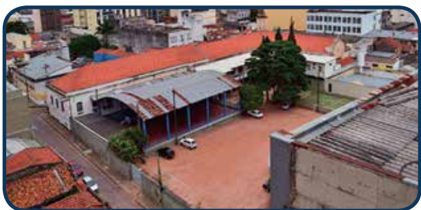
Situado na Região Leste, porém atende todas as Regiões de Campinas