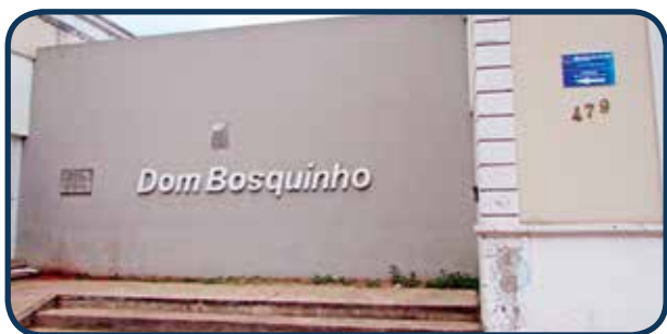
Situado na Região Leste, porém atende todas as Regiões de Campinas