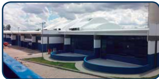
Situado na Região Sul, atende aos moradores deste território