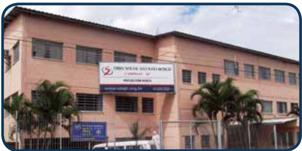
Situado na Região Sudoeste, atende aos moradores deste território