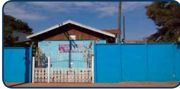
Situado na Região Sul, atende aos moradores deste território