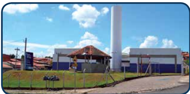
Situado na Região Sudoeste, atende aos moradores deste território