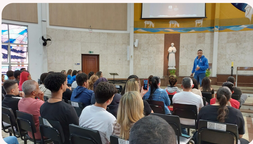
Imagem tirada no dia do encontro sociofamiliar na Paroquia São João Bosco

Seguindo as tradições de uma casa salesiana, os encontros foram iniciados com o Bom Dia ou Boa Tarde. Os colaboradores dos projetos acolheram as famílias com muita alegria e oração, realizando dinâmicas e “bate-papo”, ilustrando o dia a dia dos projetos com nossas normas, dificuldades, realizações e perspectivas, deixando em aberto para que as famílias participassem e pudessem colocar suas alegrias, expectativas, conflitos e sugestões e assim criamos, em conjunto, laços mais fortes e resilientes.