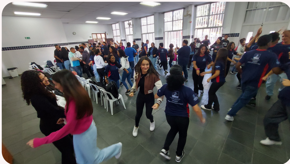
Imagem tirada da dança da felicidade.

Como mais uma dinâmica interativa, a dança da felicidade tem o intuito de fazer com que os jovens se enturmem e entendam que nosso espaço é como se fosse uma segunda casa para eles. De primeira mão, foi proposto que os alunos formassem duplas e seguissem certos passos de acordo com o decorrer da música, foi repetido uma troca de duplas três vezes e de ultima, foi proposto a dança com alguém na qual os alunos não conheciam ou nunca tivessem tido contato.