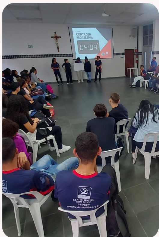
Imagem tirada da dinâmica minha quebrada.

Dentro do nosso espaço são feitas diversas dinâmicas para poder te destravar, fazer com que qualquer um que esteja em nosso espaço fique a vontade e confortável. Logo no primeiro dia foi feita uma dinâmica onde foram divididos grupos por região para poder fazer um desenho da sua “quebrada”, mostrando pontos muito conhecidos e simbólicos, mas é claro que como forma de interação, foi pedido para que cada um do grupo falasse sobre sua quebrada e sua opinião sobre ela.