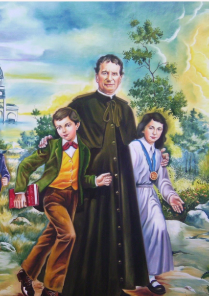
Imagens retiradas do google