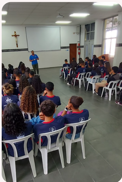
Imagem tirada durante o anuncio do show..

Com o decorrer da semana, foi anunciado um show de talentos, os alunos foram separados por habilidades, sendo elas: canto, dança, desenho, esportes, poesia, e teatro. Grande quantidade de alunos se inscreveram para a área de esportes, que foi dividida em vôlei e basquete. O grupo de poesia e canto se juntaram e se tornaram um grupo só. Alguns membros mudaram de ideia e trocaram de grupo para um resultado mais satisfatório. Foram separados três dias para os ensaios, e todos os alunos tiveram que lidar com vários desafios, sendo eles respeitar o desejo e opinião do próximo, concordar com quais coisas iriam usar e qual forma iriam se organizar, alguns grupos passaram por dificuldades porém logo se acertaram e ficaram prontos para o dia do show de talentos.