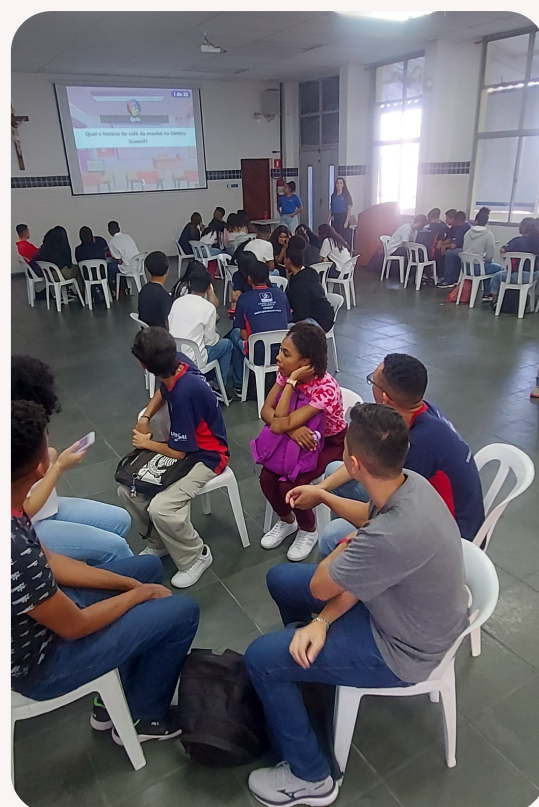
Imagem tirada da dinâmica normas e regras.

Dentro do nosso espaço existem normas e regras, e para que todos lembrem de nossas normas e regras foi feita uma dinâmica onde foram separados grupos com seus nome de equipe, e para dar início a dinâmica foram feitas perguntas com alternativas e cada grupo teria que dar sua resposta e pra cada resposta acertada o grupo ganhara pontos, e quem fizer mais pontos até todas a perguntas serem feitas ganhara um prêmio. Com isso, os estudantes se mantiveram entretidos durante todo o decorrer da dinâmica, socializando e conhecendo cada membro do grupo, além de trocar informações e descobrir sobre certas regras da instituição.