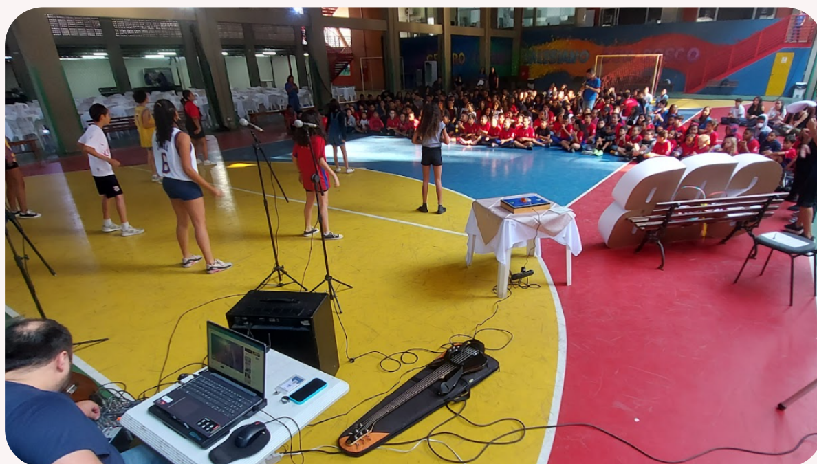
Imagem tirada do show de talentos.

Após três longos dias de ensaio incessantes, os alunos foram convocados a comparecer no dia 24/08/2023 às 08:00 da manhã até as 16:00 da tarde para assistir ao show matutino e vespertino, muitos alunos compareceram e aproveitaram de uma manhã tranquila, podendo demonstrar a todos suas verdadeiras habilidades, cada aluno venceu seu medo e usufruiu de um momento feliz ao lado dos membros e educadores da instituição, podendo obter a oportunidade de melhorar e se entregar ao show até o final do dia.