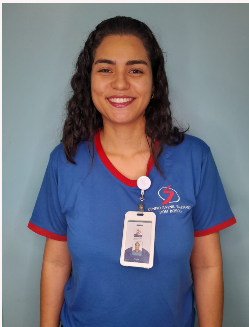
Auxiliar de Coordenação

"Sinto que me tornei uma pessoa mais madura e empática como pessoa, me colocando ainda mais no lugar do outro. Então assim, o que a gente vê é superficial as pessoas conseguem mostrar ainda mais o que elas são a partir da oportunidade que elas nos dão de conhecê-las, e, também preciso da a oportunidade delas me conhecerem".