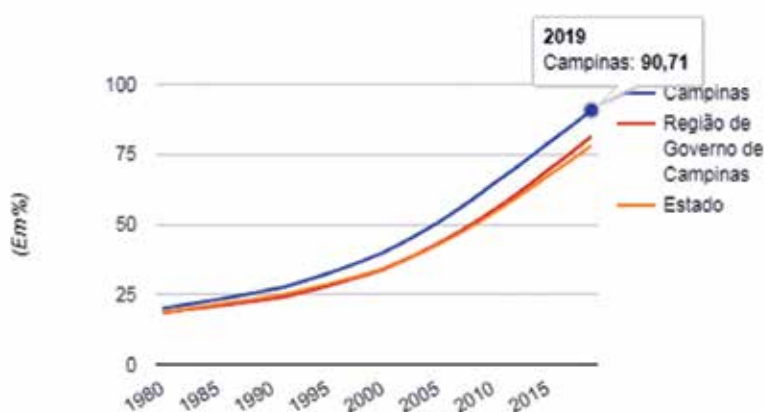
Índice de Envelhecimento (Em %) - 1980-2019

As projeções para 2019 apresentadas pelo IMP – Informações dos Municípios Paulistas – apontam, segundo a Fundação SEADE, que o índice de envelhecimento da população campineira tem crescido vertiginosamente nos últimos trinta e sete anos e já supera o índice estadual. Isso denota a necessidade de políticas públicas capazes de acompanhar o desenvolvimento da população, oferecendo-lhe mais qualidade de vida. A população com menos de 15 anos, por sua vez, tem apresentado um declínio significativo ao longo dos anos, o que representa mais um indicativo do envelhecimento da população campineira nas últimas décadas.